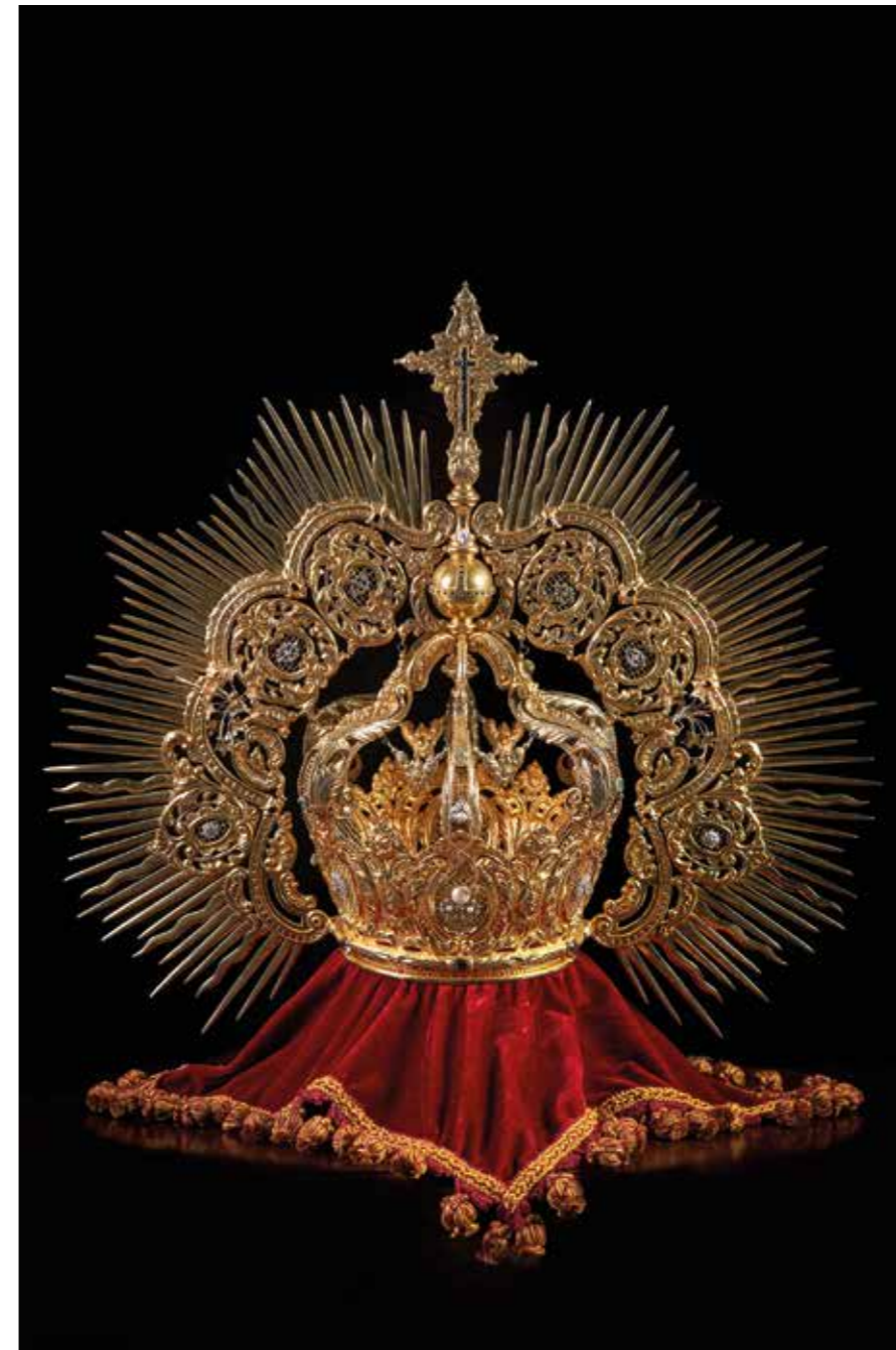
► Corona de “salida”.

Otras peculiaridades son sus piedras preciosas. Así nos lo narra: “Le añadimos una serie de topacios que adquirí a las Hermanas de la Caridad que los había traído un misionero de Madagascar. Trajo una caja llena de gemas. Se le colocaron en el primer aro una serie de topacios, que los tiene en la parte delantera y trasera. A parte de eso, se le añadieron: