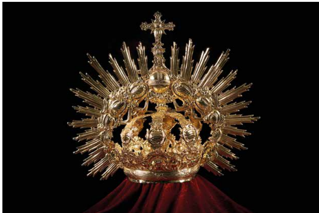
► Corona "antigua".