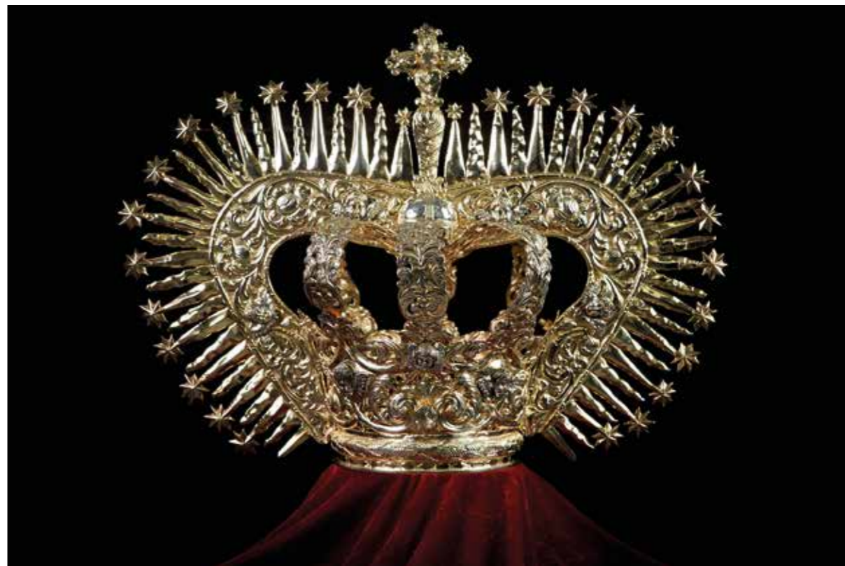
► Corona de "corazón".

fundieron y se doró la corona. Se estrenó en la Madrugá de 2005."